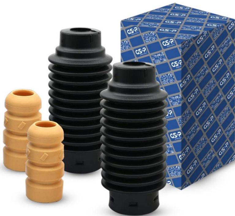
Захисний комплект амортизатора GSP

GSP: Захисні комплекти GSP - це ефективне і просте рішення, оскільки автосервісам не потрібно витрачати додатковий час на пошуки, бо комплекти містять повний набір для обслуговування амортизаторів на одній осі: два пильовики та два відбійники. Своєчасна заміна захисних комплектів, яку краще робити разом із заміною амортизаторів, поліпшує керованість автомобіля і безпеку водіння при будь-яких дорожніх умовах.