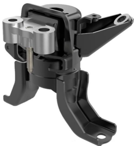
Опора двигуна GSP

GSP: Сьогодні виробник GSP Automotive Group пропонує майже 6500 артикулів, доступних на складі, включаючи гумово-металеві втулки, сайлентблоки, опори амортизатора, подушки КПП та двигуна, муфти, опорні підшипники карданного вала, захисні комплекти стійки амортизатора та інші. Всі групи також сегментовані на більш детальні підгрупи - все для задоволення ринкового попиту. Наприклад, опори двигуна є одним з наших основних продуктів, в цій групі ми також пропонуємо гідравлічні опори. Також гумометалеві втулки або сайлентблоки GSP використовуються в важелях підвіски, а також для стійки стабілізатора та інших частин.