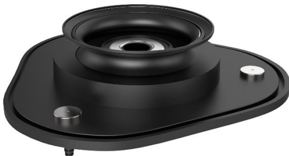
Опора амортизатора GSP

Чудова команда, сучасне обладнання та суворі виробничі системи роблять нас впевненими в якості нашої продукції.