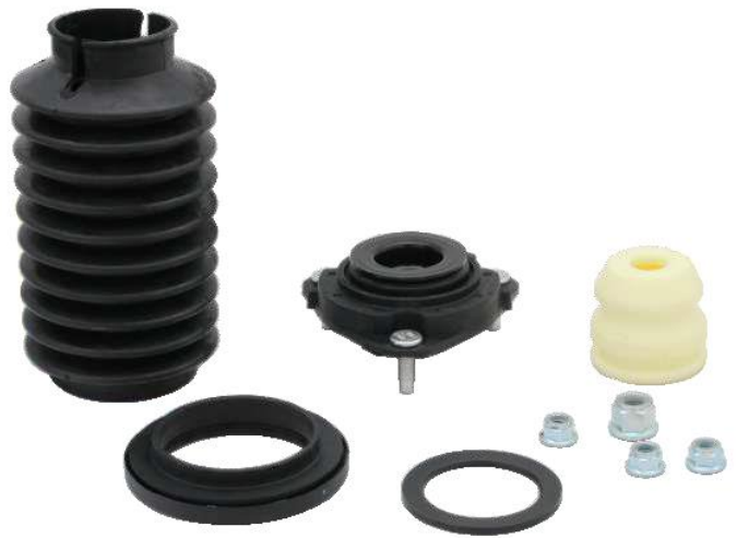
Ремкомплект опори стійки амортизатора GSP

GSP: Компанія GSP Automotive Group є постачальником гумово-металевих деталей, що має найбільший асортимент в Китаї, особливо для японських, корейських та європейських автомобілів. І через те, що ремонтні комплекти можуть підвищити ефективність роботи автосервісу, то ми звичайно пропонуємо їх нашим клієнтам. Тим більше, що заміна зношеної деталі збільшує термін служби всіх інших запчастин, а це добре для автовласника. Серед наборів ви знайдете монтажні комплекти опор амортизатора, захисні комплекти, опорні підшипники карданного вала та інші.